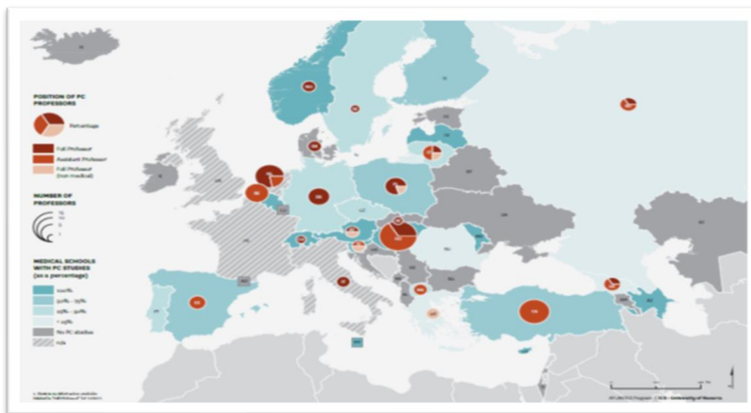
Figura 1 Atlasul EAPC de ÎP –Educație la nivel universitar.

Astfel s-au demarat o serie de initiative care să redreseze acest dezechilibru și să crească accesul la educația în ÎP [12-23]. De exemplu, într-o revizie sistematică pe doi ani (2013-2015) privind studiile despre educația universitară în ÎP, Centeno et al. a identificat 55 de studii, dar puțin peste jumătate (52%) aveau inclusă direct o evaluare a efectelor instruirii [24]. Studiile au acoperit Europa, Asia, Australia și America de Nord, majoritatea studiilor fiind calitative și axate mai degrabă pe atitudinea și încrederea participanților vizavi de practică decât pe efectele directe asupra îngrijirii pacientului. O revizie anterioară a literaturii (2007-2013), realizată de DeCoste-Lopez et al., a evidențiat 48 de intervenții de ÎP în curriculum, în 12 țări [25]. Ca și în revizia realizată de Centeno, DeCoste-Lopez remarcă o mare variabilitate în cantitatea și expunerea la instruirea în ÎP. O lipsă a detaliilor legate de raportarea intervențiilor a limitat ambele revizii, dar și înțelegerea nivelului actual de predare, făcând astfel dificil de identificat impactul educației asupra îngrijirii pacientului.